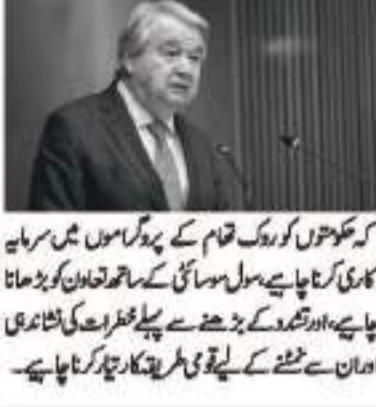
گوتھریس نے کہا کہ بین الاقوامی قانون کی دیکھ جانے پر غور و خیزاں ہونی چاہیے اور ابتدائی انتہائی علامات کے جوابات اکثر بہت کم اور بہت دیر سے ہوتے ہیں۔ مخالفت کی ذمہ داری کے حصول میں کہا گیا ہے کہ ہر ریاست کی بنیادی ذمہ داری ہے کہ وہ اپنے لوگوں کو نسل کشی، جنگی جرائم، نسل منافی اور انسانیت کے خلاف جرائم سے بچائے۔ اگر کوئی ریاست ایسا کرنے میں ناکام رہتی ہے تو بین الاقوامی برادری کو اپنی کارروائی کرنے کا اختیار حاصل ہے۔ ستر گوتھریس نے کہا

اقوام متحدہ، 7 جولائی (یو این آئی) اقوام متحدہ کے سیکریٹری جنرل گوتھریس نے رکن ممالک سے نسل کشی، جنگی جرائم اور دیگر بڑے پیمانے پر مظالم کو روکنے کے لیے بروقت اور موثر اقدامات کرنے کی اپیل کی ہے اور خبردار کیا ہے کہ بڑھتے ہوئے تنازعات، آتش اور نئی ٹیکنالوجی شہری آبادی کے لیے خطرہ بڑھا رہی ہیں۔ ستر گوتھریس نے اقوام متحدہ کی جنرل اسمبلی میں ذمہ داری کی حفاظت کے حصول (R2P) پر اپنی 18 ویں رپورٹ جاری کرتے ہوئے کہا کہ 2005 میں عالمی