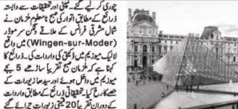
7 جولائی (یو این آئی) فرانس میں لائیک میوزیم کی صنعتوں بنانے والی معروف کھلی لائیک کے عجائب گھر سے لاکھوں یورو مالیت کے زیورات

چوری کر لیے گئے۔ یعنی اور تحقیقات سے ثابت ہے کہ ڈیکور کے مطابق آواز کی موج معلوم کرمان نے شمال مشرقی فرانس کے علاقے وین سروسور (Wingen-sur-Moder) میں واقع لائیک میوزیم میں ڈیکور کی واردات کی۔ ڈیکور کا کہنا ہے کہ ڈیکور نے تقریباً ساڑھے 5 بجے میوزیم میں داخل ہوئے اور سیدھا زیورات کے حصے کا رخ کیا۔ تحقیقاتی ڈیکور کے مطابق واردات کے دوران تقریباً 20 قیمتی زیورات چرائے گئے جن کی مالیت کم از کم 40 لاکھ یورو کے قریب ہو سکتی ہے۔ میوزیم انتظامیہ نے اپنی ویب سائٹ پر جاری کیے گئے بیان میں بتایا ہے کہ ڈیکور کے باعث چھ گھنٹہ کے دوران فرانس کے لیے بند