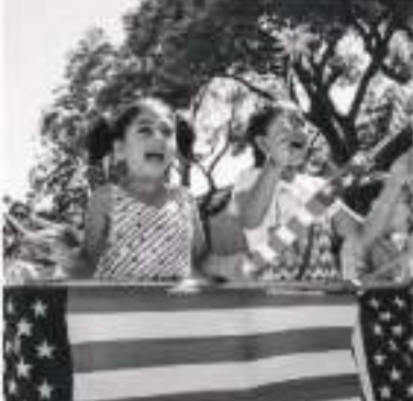
تقریبات کا دفاع کرتے ہوئے کہا ہے کہ آتش بازی ایک شاندار روایت ہے اور امید ہے کہ لوگوں نے امریکہ کی 250 سالہ تقریبات کے موقع پر ہونے والے اس منظر و مناظر سے لطف اٹھایا ہوگا۔

واشنگٹن، 7 جولائی (یو این آئی) امریکہ کا دار الحکومت واشنگٹن ڈی سی یوم آزادی کی تقریبات کے موقع پر ہونے والی بڑے پیمانے کی آتش بازی کے بعد چھ گھنٹوں کے لیے دنیا کا سب سے زیادہ آلودہ شہر بن گیا۔ ایئر پازیشن نیو کیلے اسٹور لیڈ کی فضائی معیار پر نظر رکھنے والی سختی آئی کیو ایئر کے مطابق آتش بازی سے اٹھنے والے دھوئیں کے باعث آواز کی موج تقریباً 3 بجے سے 5 بجے کے درمیان واشنگٹن ڈی سی میں فضائی آلودگی کی سطح غیر معمولی حد تک بڑھ گئی۔ یہ آتش بازی وائٹ ہاؤس کے پروگرام کے تحت منعقد کی گئی جس کا مقصد 40 منٹ میں 8 لاکھ 50 ہزار آتش بازی کے گولے فائر کر کے عالمی ریکارڈ قائم کرنا تھا۔ رپورٹ کے مطابق شہر