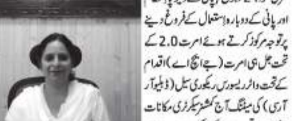
ڈپٹی کمشنر کابلڈ گام میں پولیو مہم کی تیاریوں کا جائزہ لیا۔

ڈپٹی کمشنر کابلڈ گام میں پولیو مہم کی تیاریوں کا جائزہ لیا۔ انہوں نے مکمل تیاری اور موثر نگرانی یقینی بنانے کی ہدایت دی۔