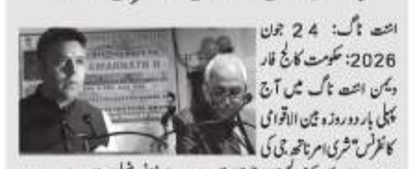
انتہا ناگ میں شری امر ناتھ جی یا ترا پر پہلی بین الاقوامی کانفرنس کا آغاز کیا گیا۔

انتہا ناگ میں شری امر ناتھ جی یا ترا پر پہلی بین الاقوامی کانفرنس کا آغاز کیا گیا۔ انہوں نے کانفرنس میں شرکت کرنے والے تمام مہمانوں کو خوشامدنیوں کا اظہار کیا۔