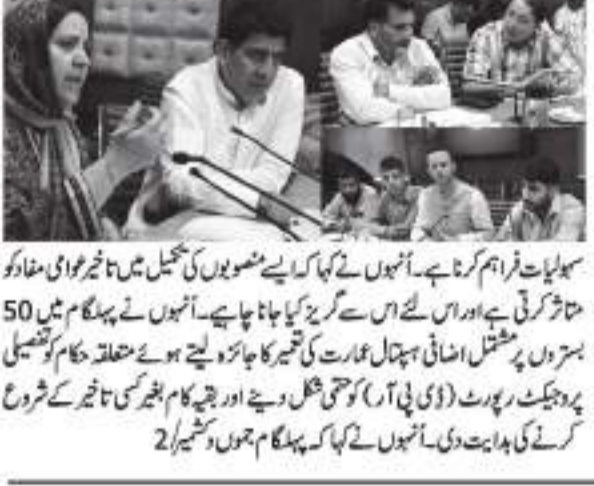
سرگرمیوں اور 24 بجوں اور برائے صحت و تعلیم، سماجی بہبود اور تعلیم و ترقی کے محکمہ جات کے سربراہان نے آج صبح سیکرٹریٹ میں ہسپتال کے تعمیراتی کاموں کی پیش رفت کا جائزہ لیا۔

سرگرمیوں اور 24 بجوں اور برائے صحت و تعلیم، سماجی بہبود اور تعلیم و ترقی کے محکمہ جات کے سربراہان نے آج صبح سیکرٹریٹ میں ہسپتال کے تعمیراتی کاموں کی پیش رفت کا جائزہ لیا۔ ایس ڈی ایچ بہلا گام کی اضافی 50 بستروں پر مشتمل ہسپتال عمارت کی تعمیراتی کاموں کی پیش رفت کا جائزہ لیا۔ سیکرٹریٹ میں ہسپتال کے تعمیراتی کاموں کی پیش رفت کا جائزہ لیا۔ سیکرٹریٹ میں ہسپتال کے تعمیراتی کاموں کی پیش رفت کا جائزہ لیا۔