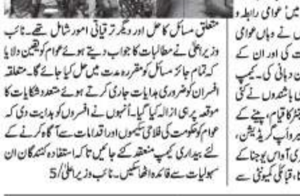
نائب وزیر اعلیٰ نے عجائبات میں عوامی رابطہ و شکایات ازالہ کمیٹی کا انعقاد کیا۔

نائب وزیر اعلیٰ نے عجائبات میں عوامی رابطہ و شکایات ازالہ کمیٹی کا انعقاد کیا۔ انہوں نے عوامی مسائل کے بروقت حل کی یقینی دہانی کی۔