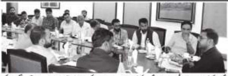
ناگ و گولگام، اے آر ٹی اور اے ڈی ٹی کے اہلکاروں نے ہلا گام میں اجلاس طلب کر کے یاتریوں کا جائزہ لیا۔

ناگ و گولگام، اے آر ٹی اور اے ڈی ٹی کے اہلکاروں نے ہلا گام میں اجلاس طلب کر کے یاتریوں کا جائزہ لیا۔ اہلکاروں نے یاتریوں کی سہولیات اور عوامی خدمات کو بروقت مکمل کرنے کی ہدایت کی۔