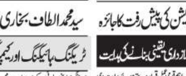
ڈپٹی کمشنر پلوامہ کا مردم شماری کے ہاؤس اسٹنڈنگ آپریشن کی پیش رفت کا جائزہ لیا۔

ڈپٹی کمشنر پلوامہ کا مردم شماری کے ہاؤس اسٹنڈنگ آپریشن کی پیش رفت کا جائزہ لیا۔ انہوں نے مکمل شدہ بلاک کی دستاویزی تصدیق پر زور دیکر ڈیٹا کی شفافیت اور ازدواجی یقینی بنانے کی ہدایت کی۔