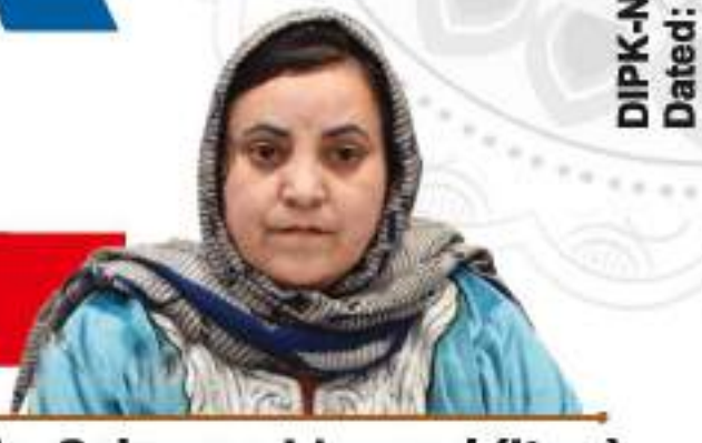
Ms. Sakeena Masood (Itoo) Hon'ble Minister for Health & Medical Education, J&K

HEALTH & MEDICAL EDUCATION DEPARTMENT DIRECTORATE OF AYUSH, J&K