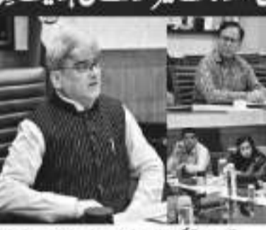
سرینگر 4 مئی // ایس ایم ای ہیلتھ چیک کے تحت 13 ہزار سے زائد ایس ایم ایز کا جائزہ لیا گیا۔

چیف سیکرٹری نے رابطوں کو مزید بڑھانے اور آرٹھیٹل اعلیٰ جنس پر مبنی اقدامات تیز کرنے کی ہدایت دی