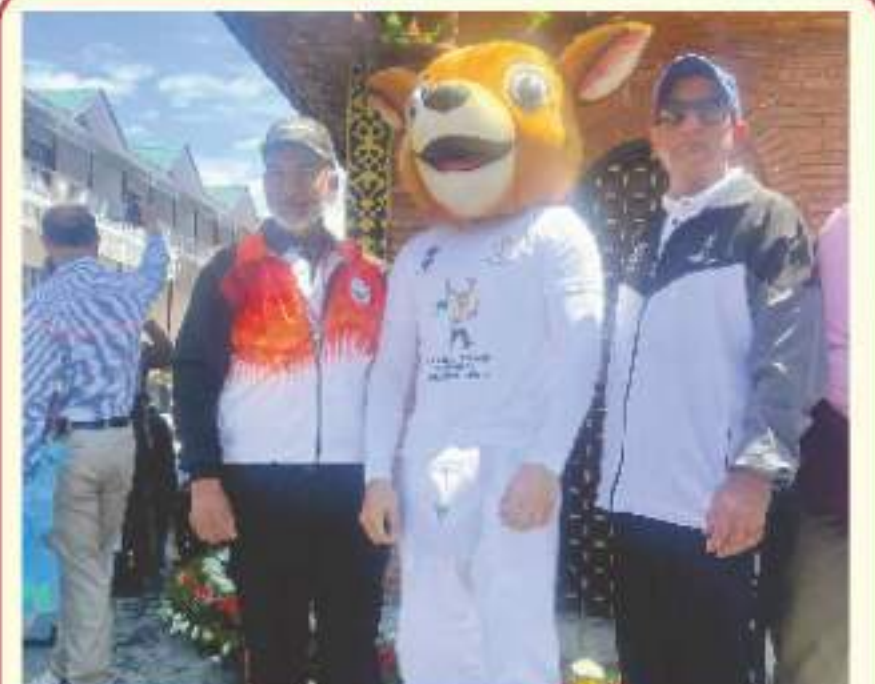
نور کھٹ بھارت میں کے جت سری عمر میں ایک عظیم الشان میگا پیڑا کا افتتاح کیا جسے لیفٹیننٹ گورنر منوج سہا نے منجھڑی دکھا کر روانہ کیا۔ اس موقع پر ایشیا کی کئی کئی ٹیموں کی اور شہادت کے خلاف بیداری میں کھڑے ہونے کے حزم کا اظہار کیا۔

لاس اینجلس، ۳ مئی (یو این آئی) فٹ بال ورلڈ کپ کے آغاز میں ۳۰ دن سے بھی کم وقت رہ گیا ہے، لیکن فورمانٹ کے ٹکٹوں کی مدد سے زیادہ ٹکٹوں کے فروغ کے ہوش اڑا دیے۔