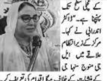
سرینگر 4 مئی // یوتھ نیشنل کانفرنس جنوبی زون کا خصوصی اجلاس آج صبح 10 بجے کے بعد وزیر اعلیٰ کے دفتر میں مختلف محکمات کے سربراہوں کی ایک وفد سے ملاقات کی۔