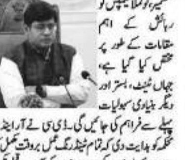
گاندربل 4 مئی // ڈی سی گاندربل کا کھیر بھوانی میلہ 2026 کے انتظامات کا جائزہ لیا گیا۔

رہائش، صفائی، بجلی، سیکورٹی اور ٹرانسپورٹ پر خصوصی توجہ مرکوز