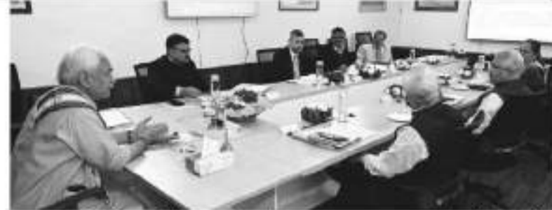
سرینگر 4 مئی // ایڈوکیٹس گورنمنٹ منوج سنہا نے لوک بھون سرینگر میں مرکز کے زیر اہتمام ایڈوکیٹس میٹنگ کی صدارت کی۔ ڈائلڈائف ایڈوکیٹس میٹنگ میں سرگرمی کی تعمیری ماحولیاتی تحفظ اور ترقی میں توازن پر زور دیا اور گلگرم ڈائلڈائف سٹیجری میں سرگرمی کی تعمیری ماحولیاتی تحفظ اور ترقی میں توازن پر زور دیا۔

نے شرکت کی۔ ایڈوکیٹس میٹنگ اور ترقی کے معاملات پر زور دیا اور گلگرم ڈائلڈائف سٹیجری، بارہمولہ میں آج صبح 10 بجے کے بعد وزیر اعلیٰ کے دفتر میں مختلف محکمات کے سربراہوں کی ایک وفد سے ملاقات کی۔