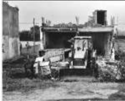
جموں 4 مئی // جموں ڈیولپمنٹ اتھارٹی نے رنگ روڈ کے ساتھ غیر مجاز تعمیرات کو روکنے کیلئے انہدامی مہم چلائی۔

غیر مجاز تعمیرات کو روکنے کیلئے انہدامی مہم چلائی