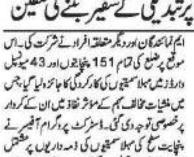
بانڈی پورہ 4 مئی // ڈی سی بانڈی پورہ کی ”ماں سے گفتگو“ مہم کے تحت خواتین کمیٹیوں سے بات چیت کی گئی۔

نشہ مکنت مہم کے تحت بیداری پروگرام کوگاؤں اور وارڈ سطح پر تبدیلی کے سفیر بننے کی تلقین