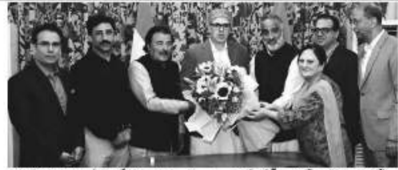
وزیر اعلیٰ عمر عبداللہ نے آج صبح 10 بجے کے بعد وزیر اعلیٰ کے دفتر میں مختلف محکمات کے سربراہوں کی ایک وفد سے ملاقات کی۔ وزیر اعلیٰ نے وفد کے رکنوں سے ملاقات کی اور عوام پر مرکوز حکمرانی کے عزم کا اعادہ کیا۔

وزیر اعلیٰ نے بروقت ازالے کی یقینی دہانی کی اور عوام پر مرکوز حکمرانی کے عزم کا اعادہ کیا