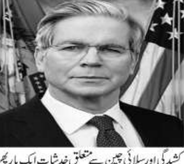
کئیڈی اور سپلائی چین سے متعلق خدشات ایک بار پھر عالمی معیشت پر اثر انداز ہو رہے ہیں۔

واشنگٹن۔ کیم سی۔ ایم این این امریکی وزیر خزانہ اسکاٹ سینٹ نے چینی نائب وزیر اعظم ہی لیٹینگ کے ساتھ اہم تجارتی بات چیت کی، جس میں دونوں ممالک کے درمیان اقتصادی تعلقات اور آئندہ اعلیٰ سطحی مذاقاتوں پر تبادلہ خیال کیا گیا۔ بات چیت کو "واضح اور جامع" قرار دیتے ہوئے سینٹ نے چین کے حالیہ "ایکسٹرا میورینول" تجارتی ضوابط پر تشویش کا اظہار کیا، اور کہا کہ یہ اقدامات عالمی سپلائی چینز پر منفی اثر ڈال سکتے ہیں۔ یہ گفتگو ایسے وقت میں ہوئی ہے