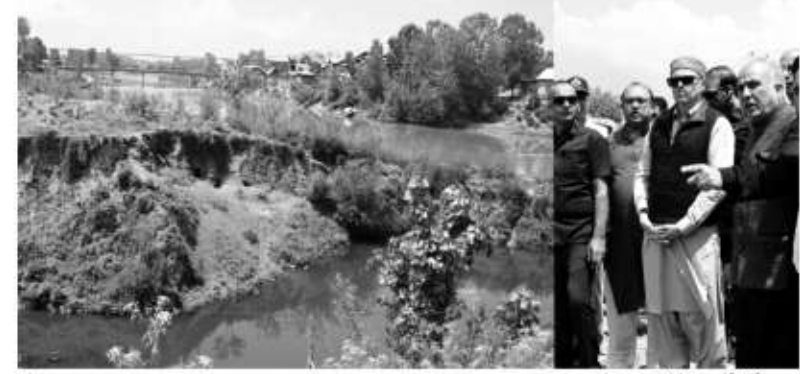
وزیر اعلیٰ عمر عبداللہ نے آج کے قریب شالینا کا دورہ کیا اور اس جگہ کا معائنہ کیا جہاں گزشتہ سارس تمبر میں سیلاب کے

بندوں کو مضبوط بنانے کی ہدایت، مستقل مرمت کے کام جلد مکمل کرنے پر زور