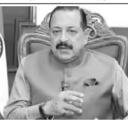
نئی دہلی 27 اپریل (ایوان آئی) مرکزی وزیر ڈاکٹر جتیندر سنگھ نے پیر کے روز کہا کہ روس کے بعد ہندوستان تجارتی سطح پر فاسٹ بریڈری ایکٹر چلانے والا دنیا

ڈاکٹر جتیندر سنگھ نے ارکان پارلیمنٹ اور اراکین اسمبلی کی اسمبلی ناؤ پوری ایکٹر ورکشاپ سے خطاب کرتے ہوئے کہا کہ ہندوستان نے نئی نئی ٹیکنالوجی کے لیے مقامی طور پر ڈیزائن کیے گئے 500 میگاواٹ کے پریوڈنٹ فاسٹ بریڈری ایکٹر (پی ایف بی آر) کو تیار کرنے کے لیے ایک اہم کامیابی حاصل کی ہے۔ اس ری ایکٹر نے 6 اپریل کو پہلی بار کوشش کی۔ پی ایف بی آر ایکٹر اندر گاندھی نیوکلیئر ریسرچ سینٹر (آئی جی سی اے آر) کی جانب سے تیار کیا گیا اور بھارتی کوششوں کے ذریعے تعمیر کیا گیا ہے، جو ہندوستان کے تین مرحلوں پر مبنی جوہری توانائی پروگرام کے دوسرے مرحلے کے آغاز کی علامت ہے۔ یہ ری ایکٹر یورینیم-پلیوٹونیم مگسڈ آکسائیڈ اینڈینس کا استعمال کرتے ہوئے چلتی توانائی خرچ کرتا ہے اس سے زیادہ ایندھن پیدا کرتا ہے۔ اس کامیابی کے ساتھ ہندوستان اپنی جوہری حکمت عملی کے تیسرے مرحلے میں