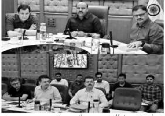
جموں، 27 اپریل // نائب وزیر اعلیٰ سریندر کمار چوہدری نے آج سول سیکرٹریٹ جموں میں جموں و کشمیر میں غیر ممکن کھڈس کے متعلق مسائل کا جائزہ لینے کے لئے قائم سب کمیٹی میٹنگ کی صدارت کی۔

جموں، 27 اپریل // نائب وزیر اعلیٰ سریندر کمار چوہدری نے آج سول سیکرٹریٹ جموں میں جموں و کشمیر میں غیر ممکن کھڈس کے متعلق مسائل کا جائزہ لینے کے لئے قائم سب کمیٹی میٹنگ کی صدارت کی۔ کمیٹی کے سربراہان نے تمام سیلاب زدہ علاقوں کے تحفظ پر زور دیا، تاکہ ہم کمیٹی نے تمام اضلاع میں ایٹو ایس پڑے عوامی معاملات کا موثر طریقے پر حل کرنے کے لئے غیر ممکن کھڈس کے پیچیدہ علاقوں کی نشاندہی کریں۔ میٹنگ میں وزیر برائے جیل سٹی، جنگلات و ماحولیات اور قبائلی امور جاوید احمد رانا اور وزیر برائے زرعی پیداوار، دہلی ترقی و پانچابٹی راج، امداد باہمی اور انکیشن حکمہ جات جاوید احمد ڈار نے سب کمیٹی کے ارکان کے طور پر شرکت کی۔ میٹنگ کے شروعات میں ایڈیشنل چیف سیکرٹری جیل سٹی شائین نے تمام سیلاب زدہ علاقوں کے تحفظ پر زور دیا، تاکہ ہم کمیٹی نے تمام اضلاع میں ایٹو ایس پڑے عوامی معاملات کا موثر طریقے پر حل کرنے کے لئے غیر ممکن کھڈس کے پیچیدہ علاقوں کی نشاندہی کریں۔ میٹنگ میں وزیر برائے جیل سٹی، جنگلات و ماحولیات اور قبائلی امور جاوید احمد رانا اور وزیر برائے زرعی پیداوار، دہلی ترقی و پانچابٹی راج، امداد باہمی اور انکیشن حکمہ جات جاوید احمد ڈار نے سب کمیٹی کے ارکان کے طور پر شرکت کی۔ میٹنگ کے شروعات میں ایڈیشنل چیف سیکرٹری جیل سٹی شائین نے تمام سیلاب زدہ علاقوں کے تحفظ پر زور دیا، تاکہ ہم کمیٹی نے تمام اضلاع میں ایٹو ایس پڑے عوامی معاملات کا موثر طریقے پر حل کرنے کے لئے غیر ممکن کھڈس کے پیچیدہ علاقوں کی نشاندہی کریں۔