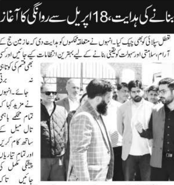
عازمین کو کسی قسم کی دشواری کا سامنا نہ کرنا پڑے۔ اس موقع پر بتایا گیا کہ 18 اپریل سے 2026ء عازمین حج کی روانگی شروع ہوگی اور اس سال جموں و کشمیر سے کل 4,764 عازمین حج سفر کریں گے، جن میں 1,159 کا تعلق ضلع سرینگر سے ہے۔

کہہ چکے۔ سکول کی تعلیم کے ساتھ تفصیلی مشاورت کریں اور زمینی سطح سے تمام پھلوں کو مد نظر رکھ کر ان اقدامات کو حتمی شکل دیں۔ انہوں نے طلبہ کو مستقبل